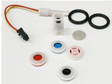
45262200 Поплавок магнитный для датчика протока